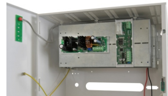
System zasilania dla switchy PoE: